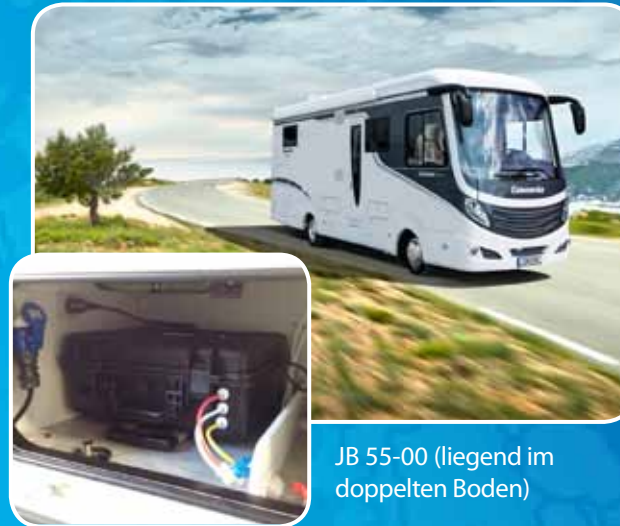
JB 55-00 (liegend im doppelten Boden)